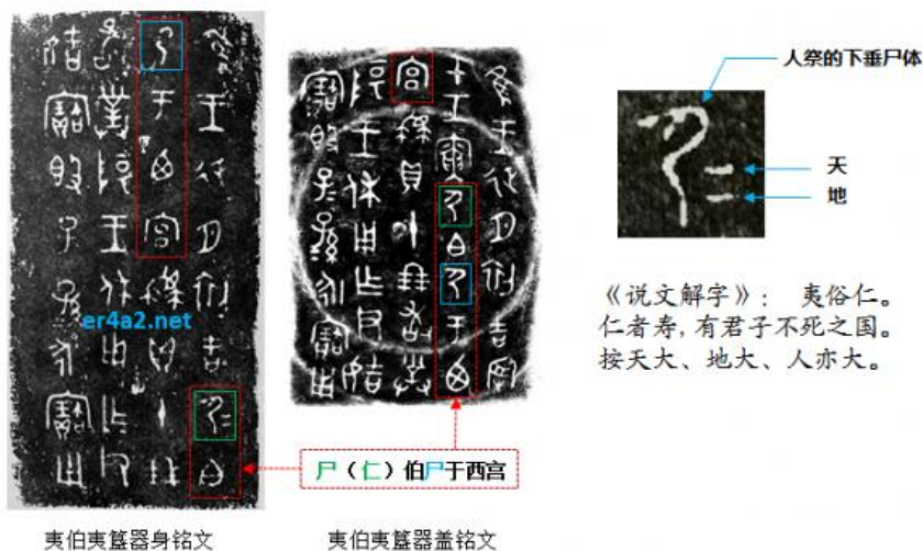
图二：中国现存最早的“仁”字

最早的“仁”字，不是由“人”和“二”组成，而是由“尸”和“二”组成。1981年陕西出土的夷伯夷簋，是“仁”字演化的一个里程碑。该器皿被定性为西周晚期之器，大约早孔子出生300年左右。